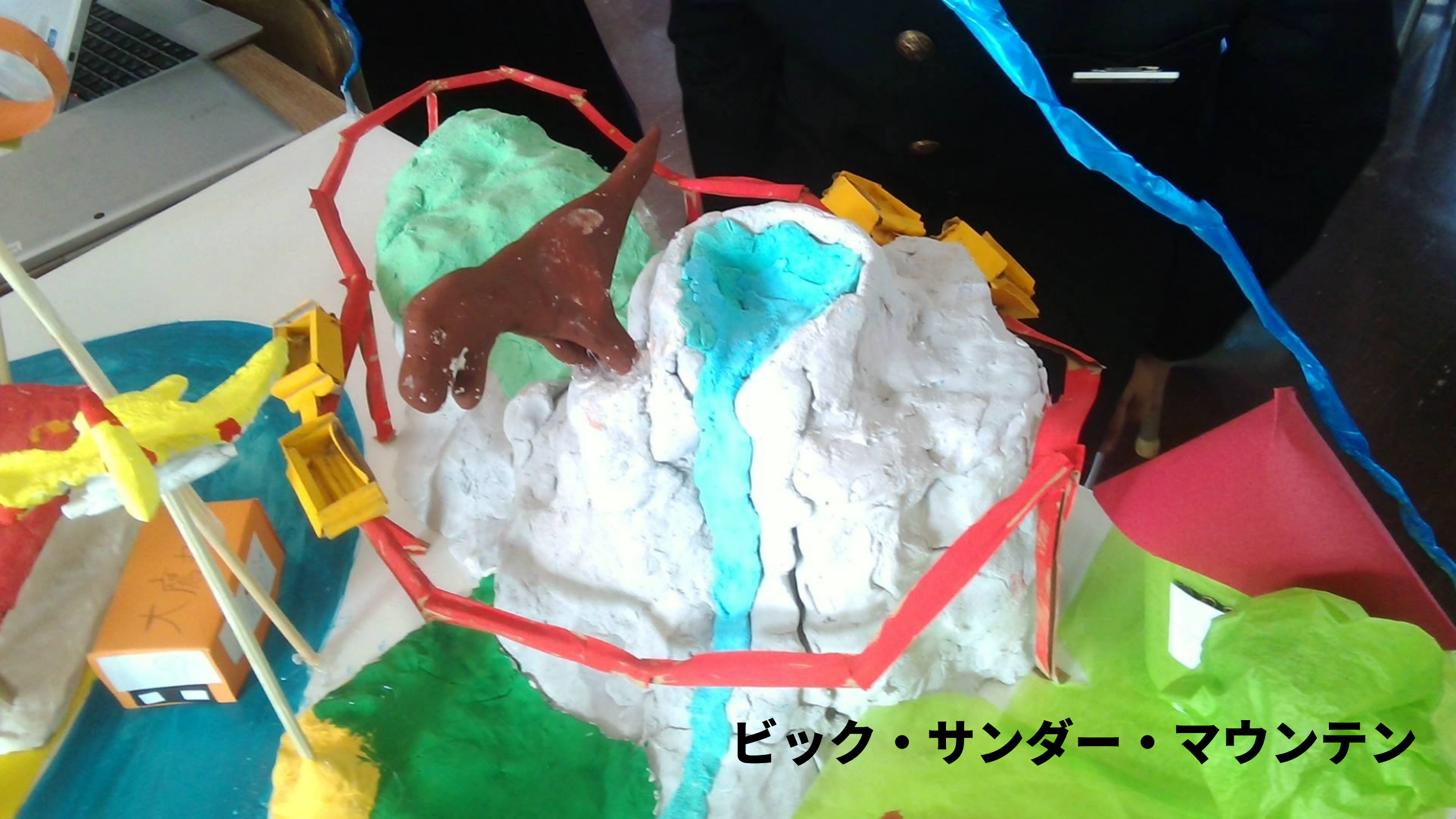
ビック・サンダー・マウンテン